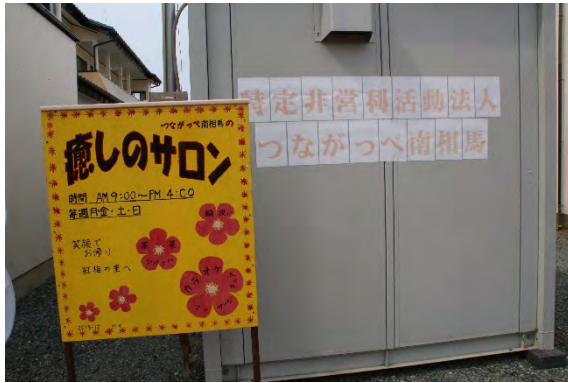
癒しのサロン看板