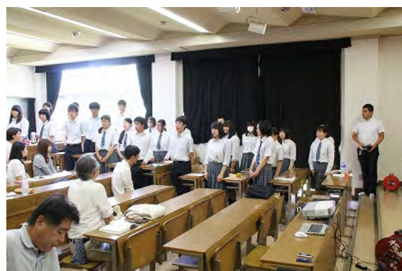
農業クラブのみなさん

相馬農業高校は、震災後、地域と共に様々な活動に取り組んできており、その活動内容について生徒による活動報告を受けた。当日は、3つのグループ発表（南そうま復幸植樹会、油奈ちゃん、苗生産技術の確立）、と1件のプロジェクト発表（相馬農業高校の農業クラブの概要）があった。また、意見発表では、生徒自身の震災の体験に引き付けながら、生産科・食品科における学びを卒業後にどのように活かしていくかなどについて、3名の3年生が表明した。それぞれの発表の後には、質疑応答が設けられ、フロアから活発な意見やアドバイスがなされた。なお当校は、農業クラブの県大会を今週の木曜日に控え、当日はそのための発表練習であった。また、休憩時間には、昨日に訪問した復幸植樹園で採れる、ハマナスの花弁を使用したお茶をいただいた。